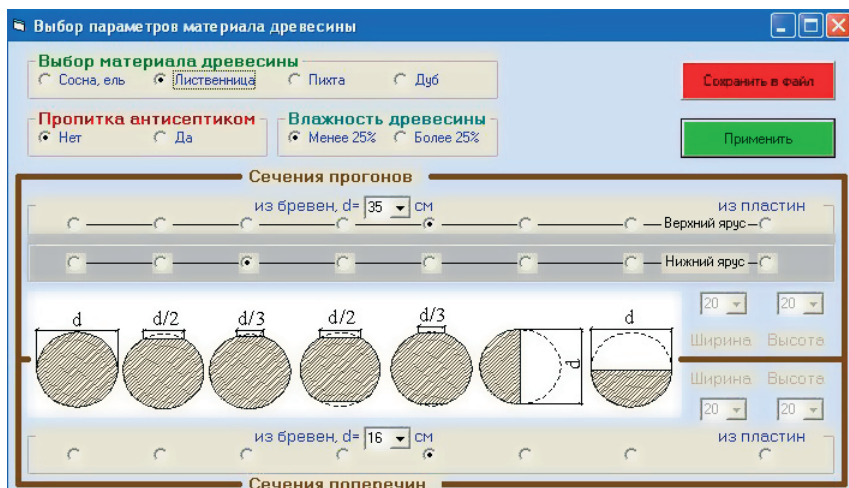
Рис. 2. Дополнительное меню «Выбор параметров материала древесины» программы Wooden Bridges

При выборе оптимального варианта расчёта программа запрашивает только значение ширины и длины пролёта, тип проезжей части и вид нормативной нагрузки (А-8, НГ-60), а в отдельном меню «Выбор параметров материала древесины» (рис. 2) необходимо указать характеристики материала брёвен или пластин поперечин, прогонов и досок.